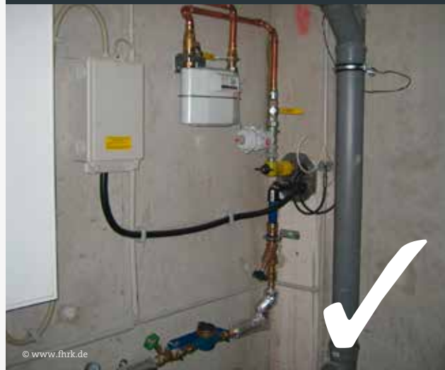
Abb. 2: Praxisbeispiel Mehrspartenhauseinführung

Für Ihre Standard-Netzanschlüsse DA32 (Gas und Wasser) und 35mm 2 (Strom) muss ein nach DIN 18322 und DVGW-VP 601 zugelassenes Hauseinführungssystem eingebaut werden