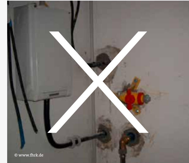
Abb. 3: Nicht gas- und wasserdichte Ausführung